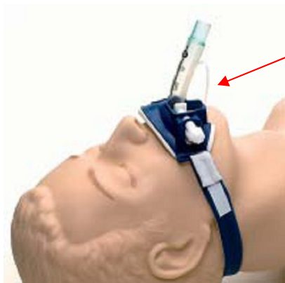
uchwyt dla dorosłych